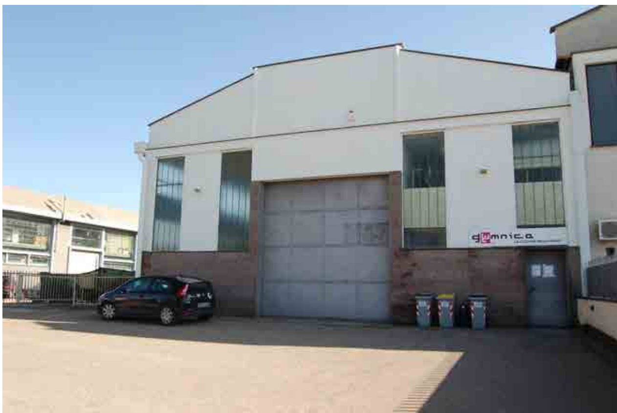
Foto 2 –Vista fronte ingresso principale del Capannone artigianale