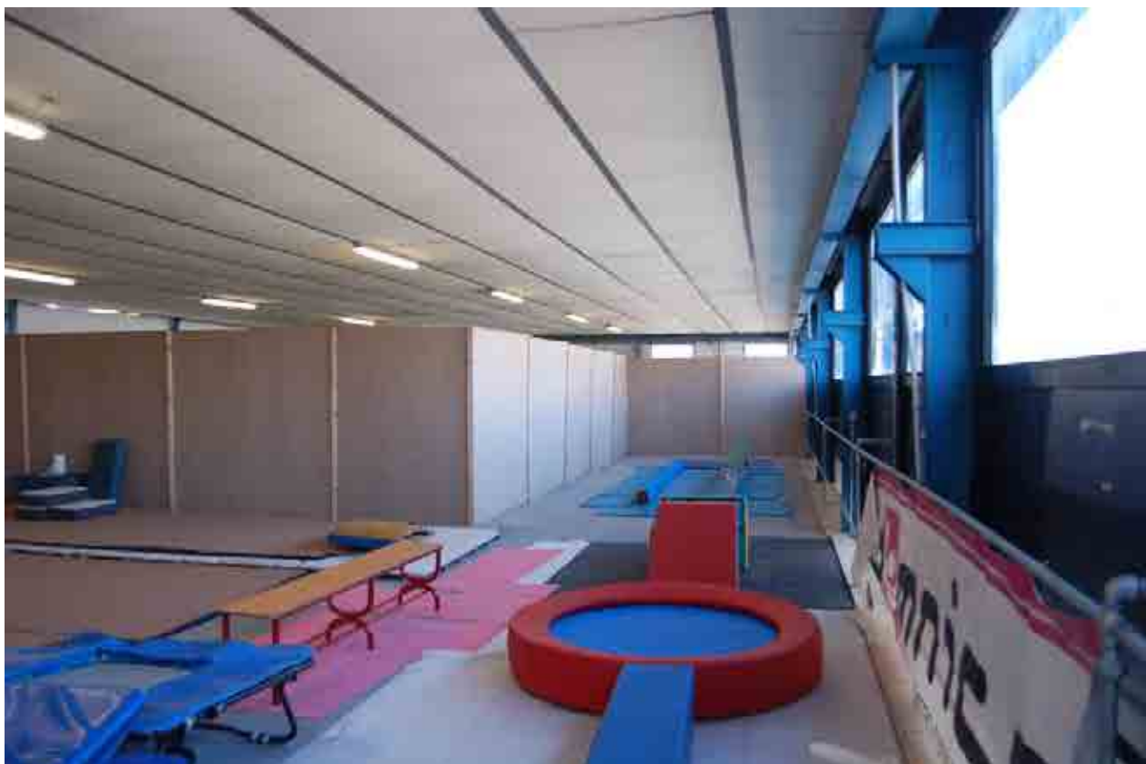
Foto 21 - Area adibita a palestra al piano soppalcato