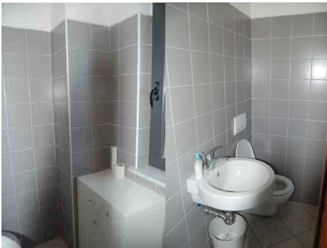
Foto 45 - Bagno