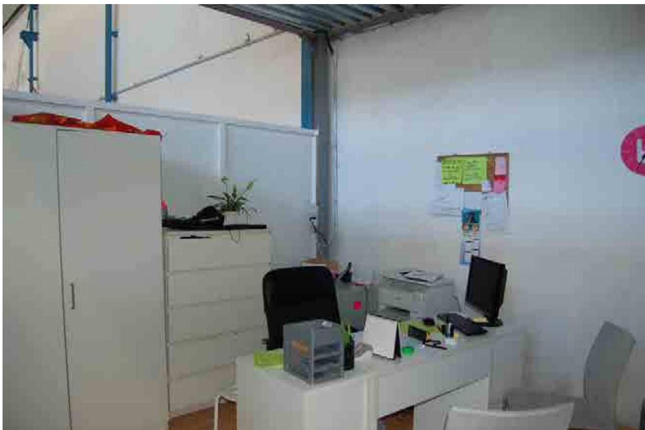
Foto 11- Area ad ufficio