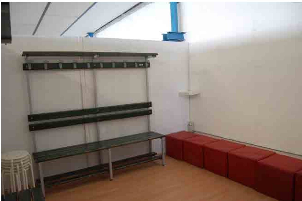
Foto 14- Spogliatoio uomini su soppalco