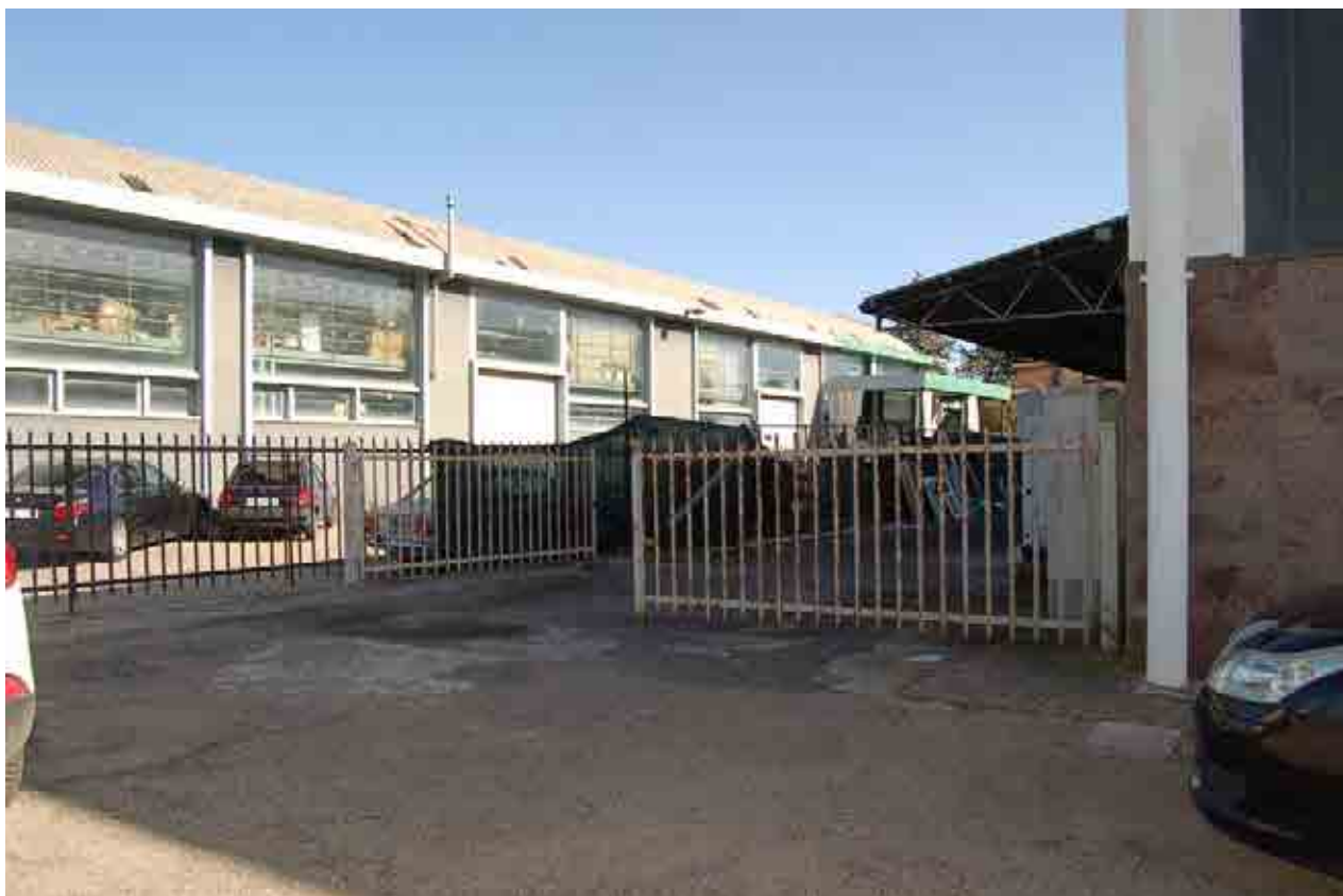
Foto 3 – Cancello divisorio interno al terreno di pertinenza del compendio pignorato