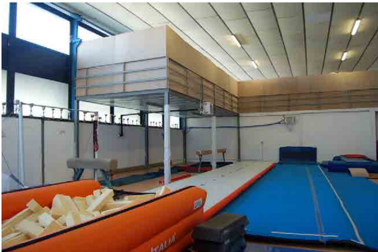
Foto 19 - Area adibita a palestra al piano terra