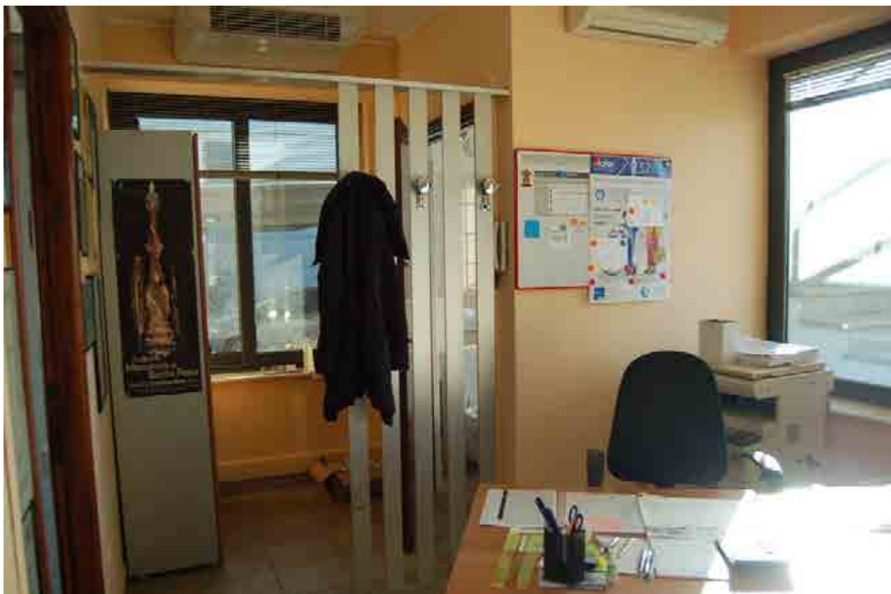
Foto 33 - Ingresso disimpegno