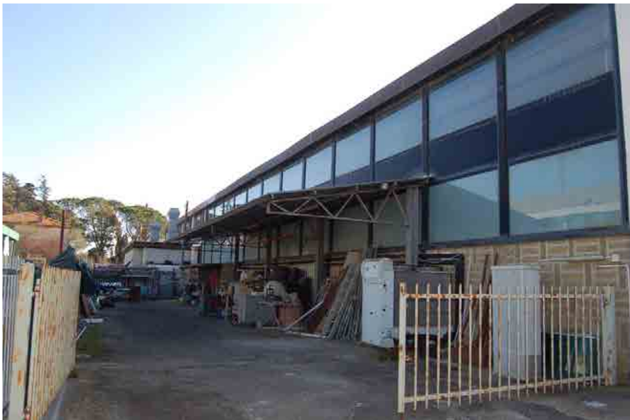
Foto 4 - Vista fronte ingresso secondario del Capannone