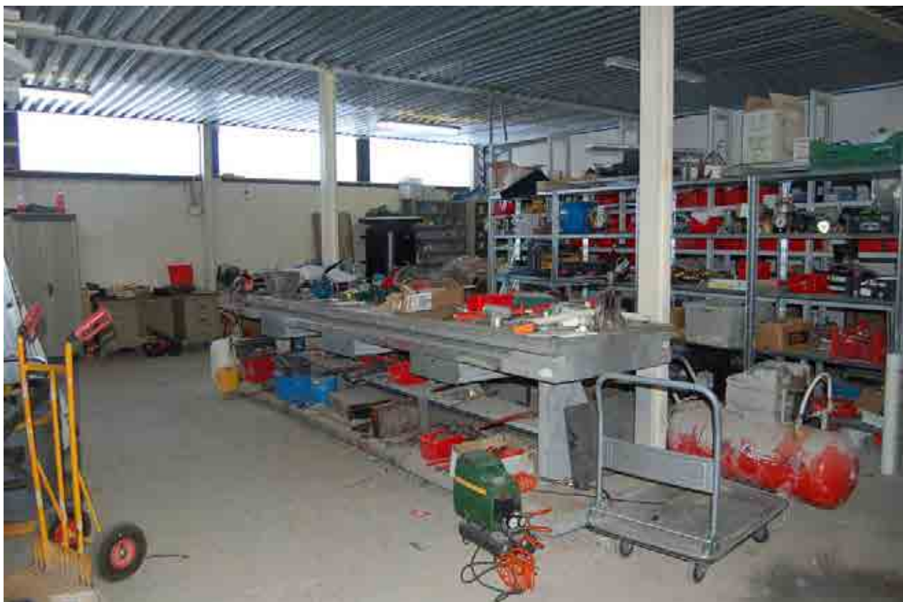
Foto 23 - Locale adibito a deposito