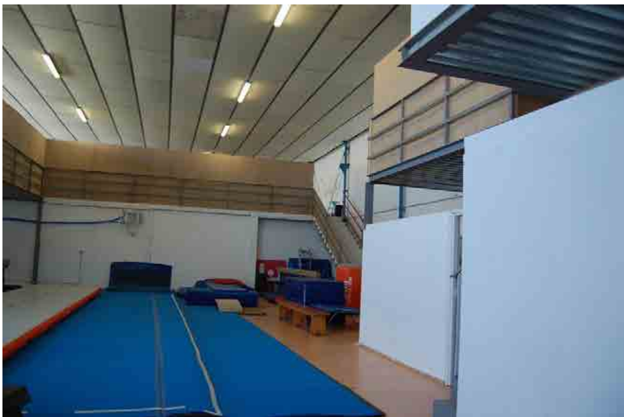
Foto 18- Area adibita a palestra al piano terra