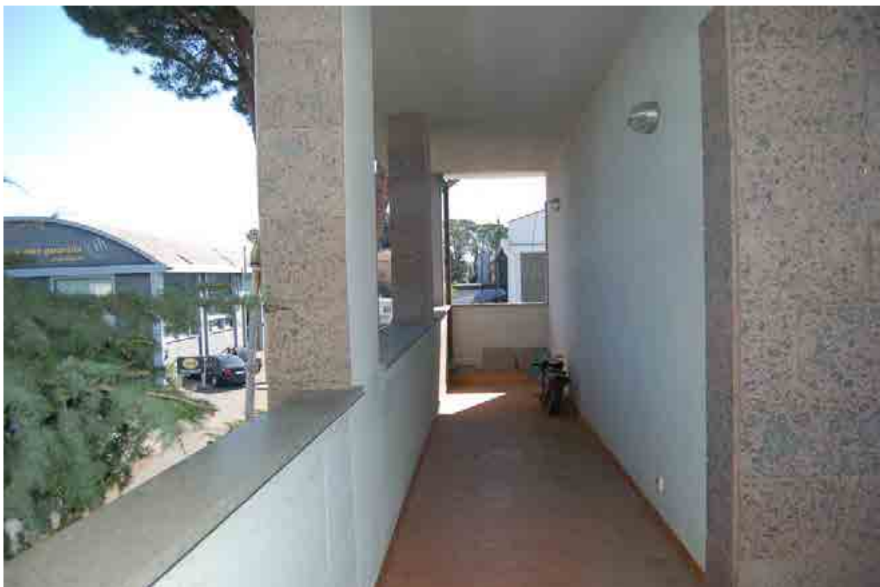
Foto 47 - Terrazza esterna fonte nord