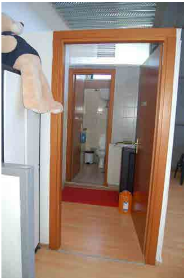
Foto 16 - Disimpegno e bagno