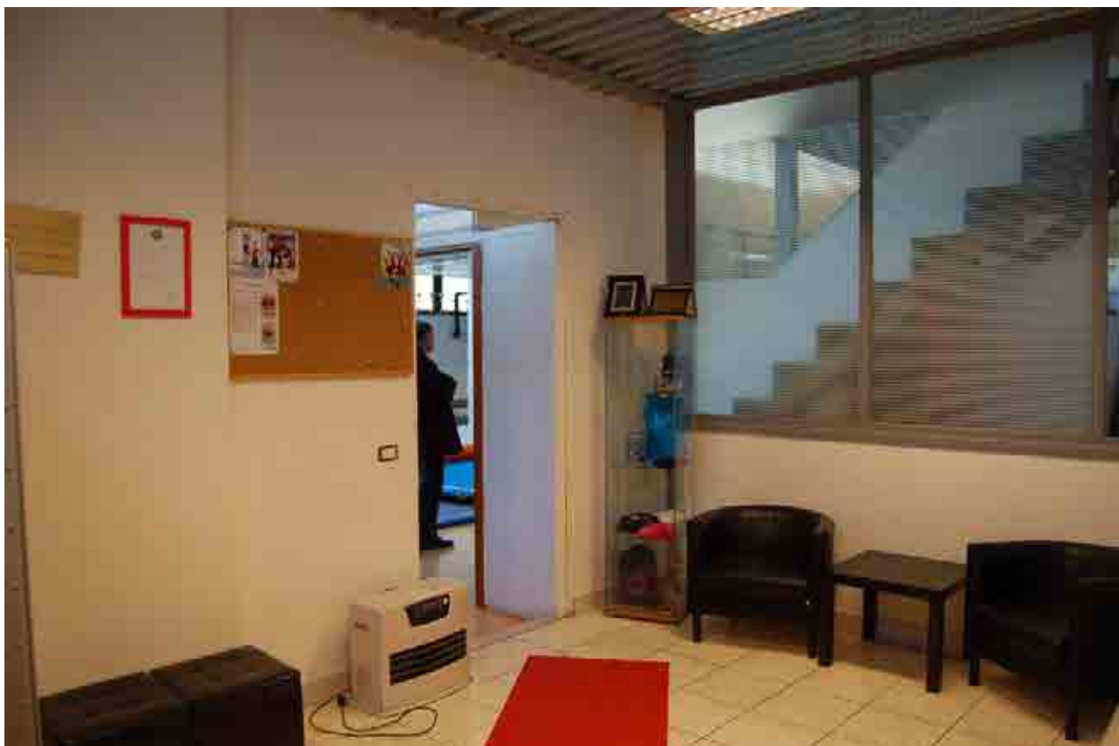
Foto 9 - Ingresso area adibita a palestra