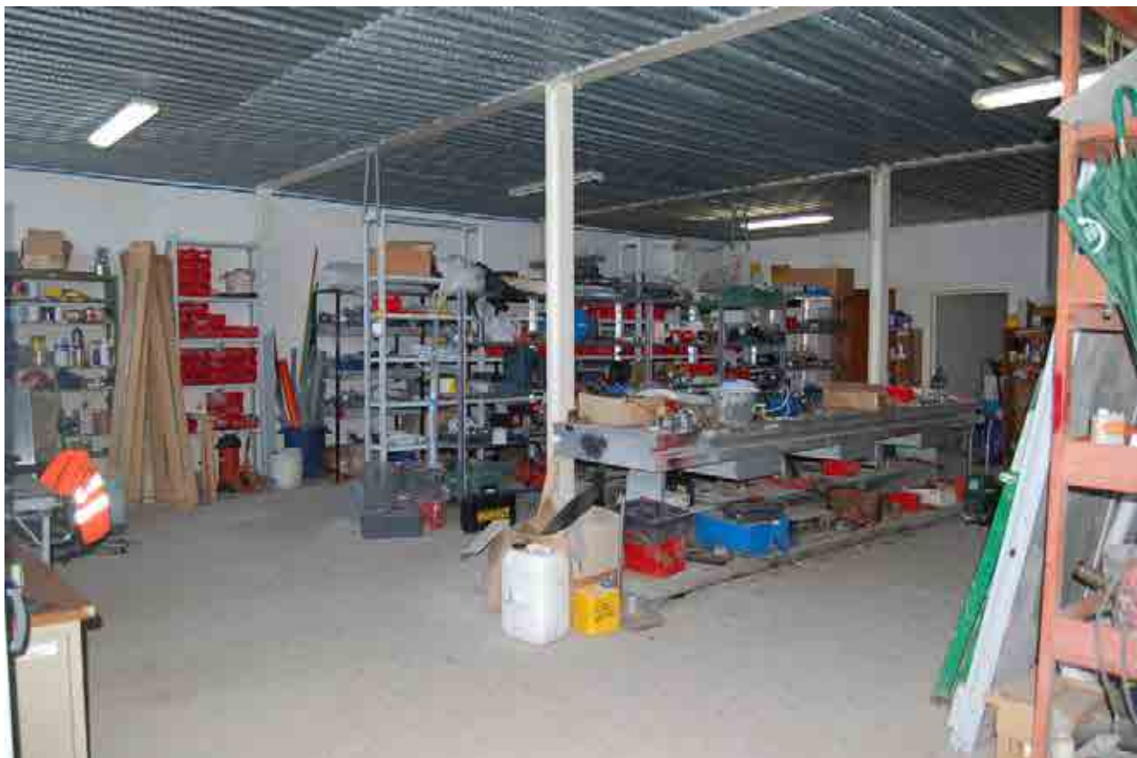
Foto 22- Locale adibito a deposito