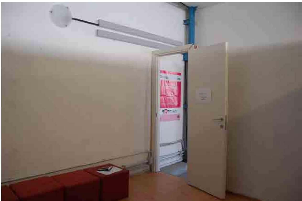
Foto 15 - Spogliatoio uomini su soppalco