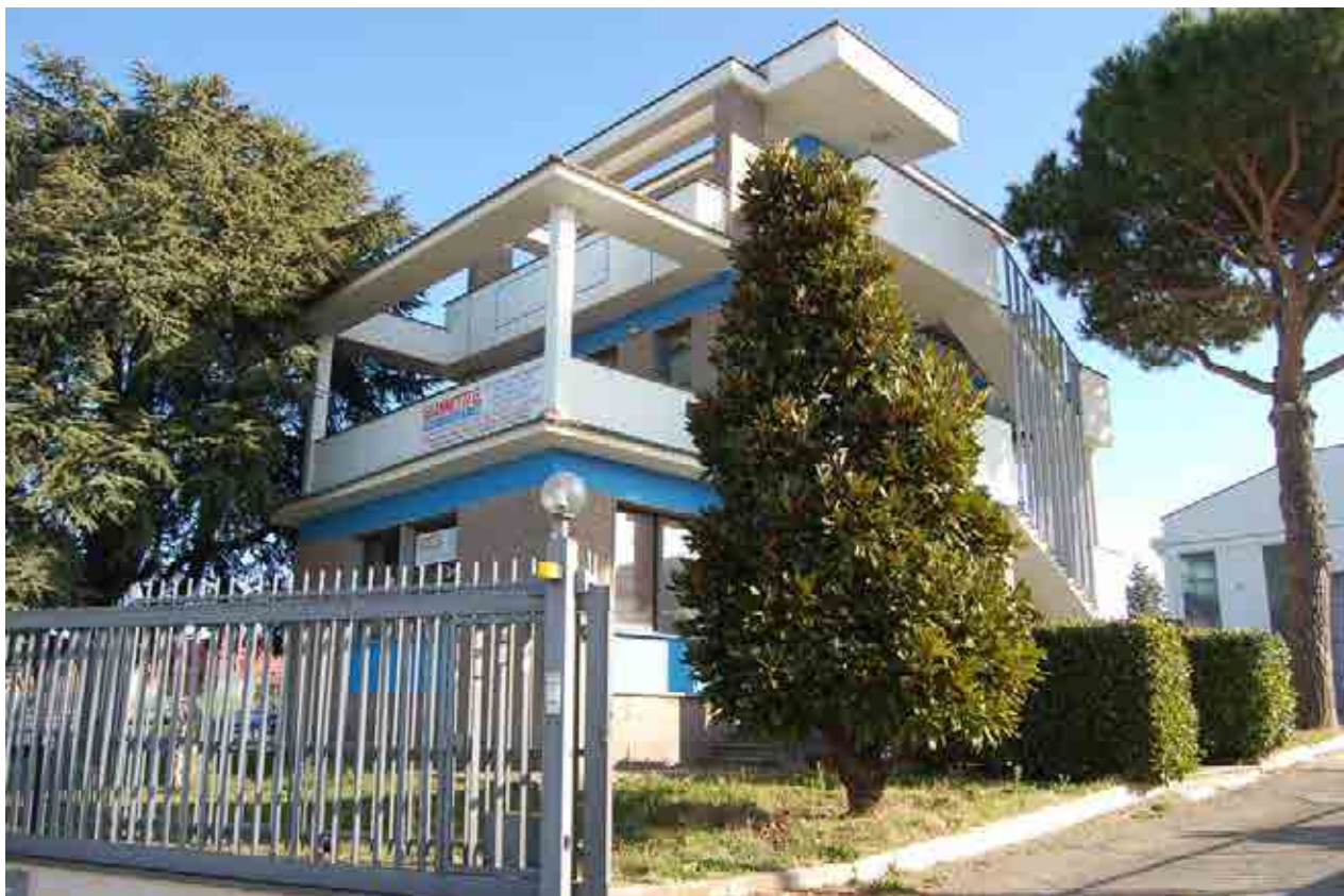
Foto 30 – Fabbricato all'interno del quale si trova l'immobile adibito ad uffici