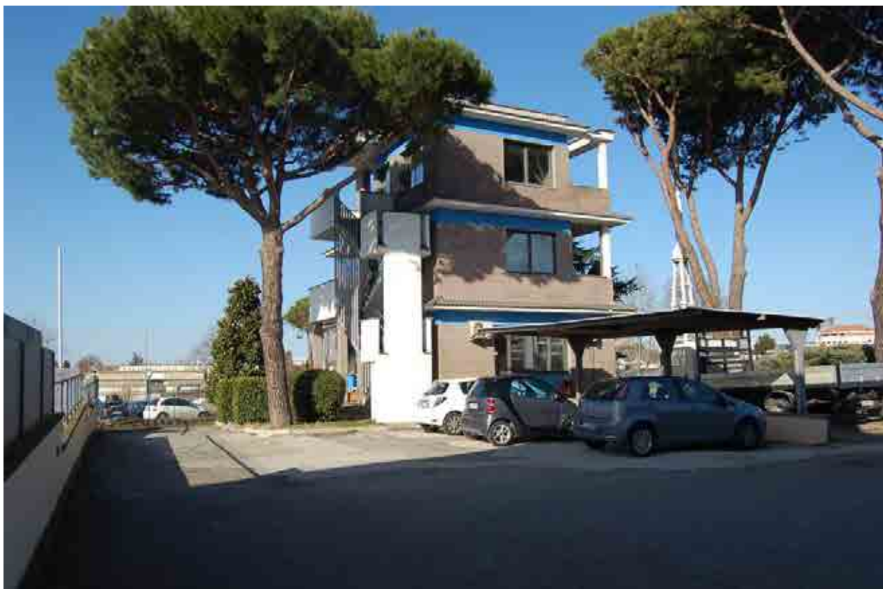
Foto 27- Area di manovra mezzi e parcheggio