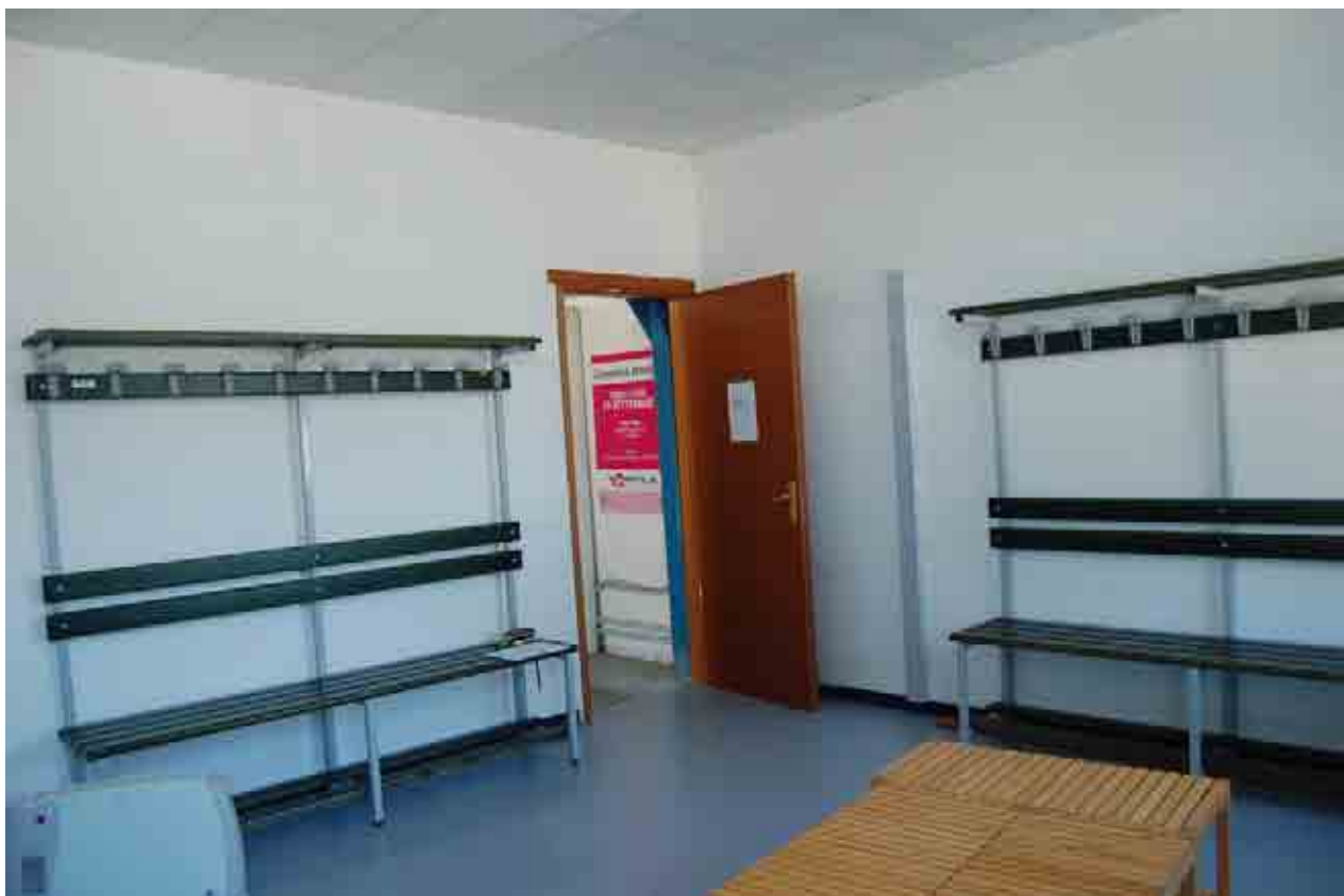
Foto 13- Spogliatoio donne su soppalco