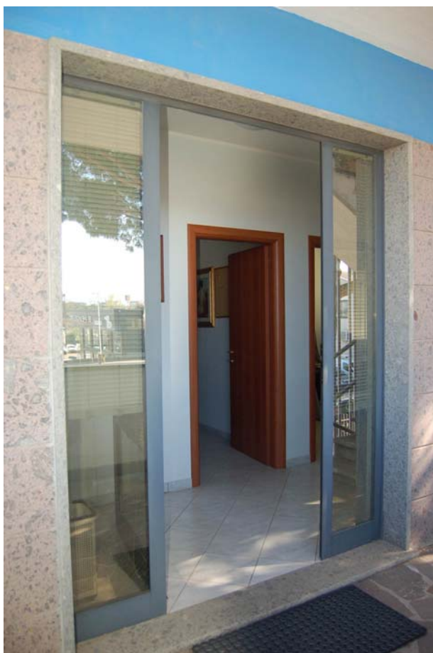
Foto 40 - Ingresso locali piano primo